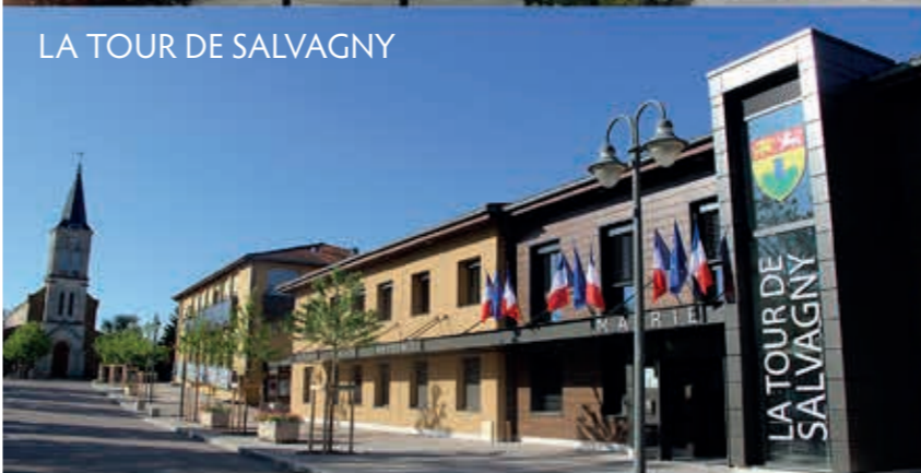
LA TOUR DE SALVAGNY