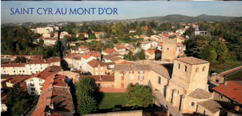
SAINT CYR AU MONT D'OR