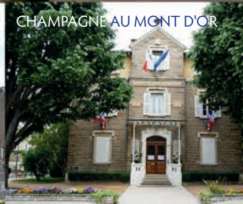
CHAMPAGNE AU MONT D'OR